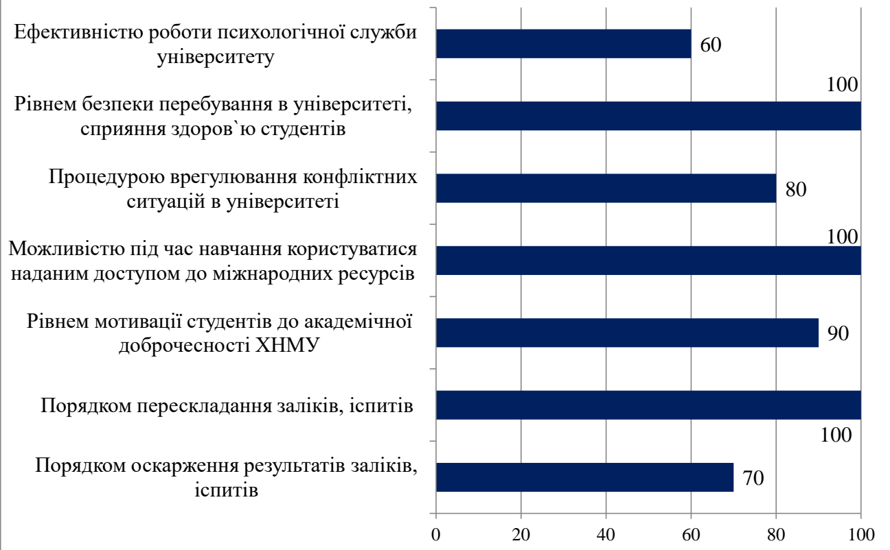
Рис. 2. Рівень задоволеності різними аспектами, пов'язаними із навчанням (%)

Судячи з отриманих даних, найбільше наші респонденти задоволені рівнем безпеки перебування в університеті, сприяння здоров'ю студентів, порядком перескладання заліків та іспитів та можливістю під час навчання користуватися наданим доступом до міжнародних ресурсів (вказало усі 100 % опитаних). Найменше опитані в ході дослідження студенти задоволені ефективністю роботи психологічної служби університету (60 %).