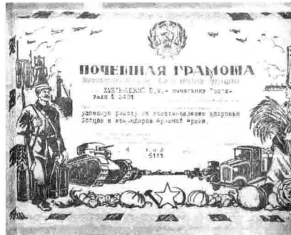
Почетна грамота проф. Б.М.Хмельницького, Новосибірськ, 1943 р.