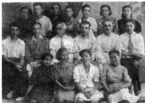
Викладачі та студенти 1-го ХМІ у Чкалові, 1943 р.