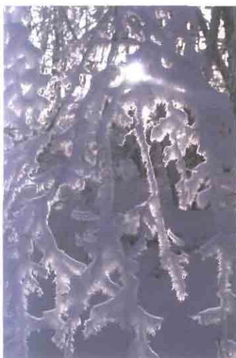
Зазеркалье. Автор А.Ю. Титова

В объективе – авторские работы участников конкурса «НХ второе призвание»