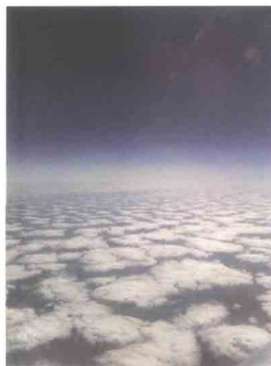
Небесные льдинки. Автор Н.И. Завгородняя