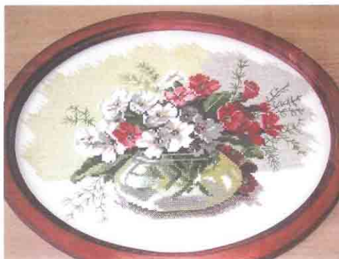
Примулы. Автор З.П. Петрова

В объективе – авторские работы участников конкурса «НХ второе призвание»