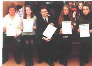
Молоді науковці ХНМУ