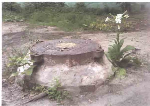
Физика и лирика. Автор Н.И. Завгородняя