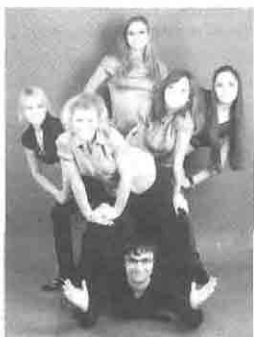
«140/80», I мед. ф-т

К подготовке молодых команд ребята подходят с большой ответственностью, требовательностью и принципиальностью: регулярность тренировок и строгая «спартанская» дисциплинированность игроков. Такой подход позволяет дольше удерживать сознание игроков в смысловом пространстве КВН, освоиться в нем и приучить каждого игрока именно к командной игре. Подготовка участников и их номеров проводится не только с учетом самых последних достижений в КВН как Украины, так и стран СНГ, но и с использованием собственных импровизаций и работ. Таким образом актуализируется внутренний мир каждого участника, его мировоззрение и пока еще небольшой жизненный опыт.