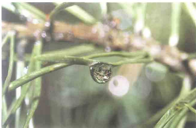
Отражение. Автор А.Ю. Титова