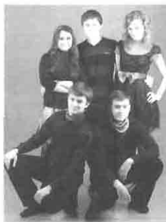
«4 Ленина», III мед. ф-т

Всего лишь за год своей деятельности в данном направлении ребята подготовили 3 молодых команды («7 диоптрий», «140/80», «4 Ленина»), которые смогли не только успешно выступить и завоевать призовые места на играх КВН в ХНМУ, но и стать популярными среди студентов нашей alma mater. Наиболее активные игроки команд совершенствуют себя в составе «Минздрав предупреждал...» на играх Харьковской городской Молодежной Лиги КВН, обогащая полученным опы-